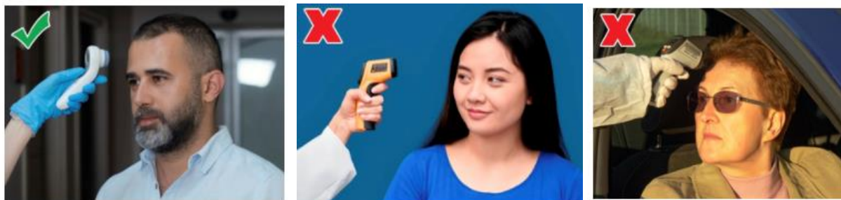
Imagen No. 1 que muestran forma correcta e incorrectas de tomas la temperatura con TISC.