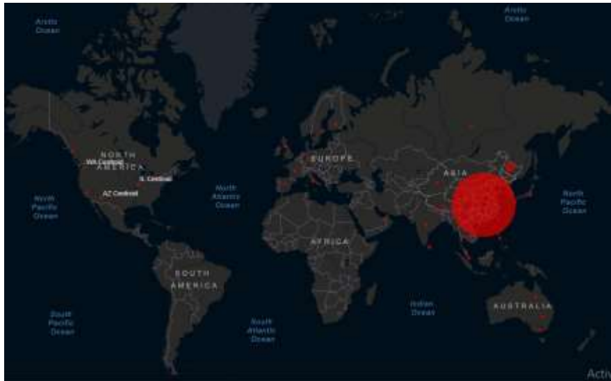
Imagen y datos tomados de 2019-nCoV Global Cases (by Johns Hopkins CSSE) – Enero 31/20 7 pm ET ( https://gisanddata.maps.arcgis.com/apps/opsdashboard/index.html#/bda7594740fd40299423467b48e9ecf6 )

La Comisión Global de Salud Pública estará informando de manera periódica y realizando actualización de las recomendaciones generales que apliquen a los países keralty y estrategias conjuntas de contingencia cuando la situación lo amerite.